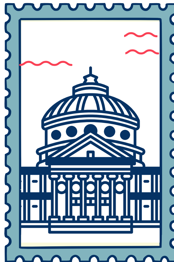
Белият дом САЩ