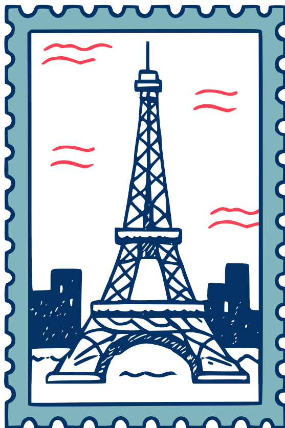
Айфелова кула Франция