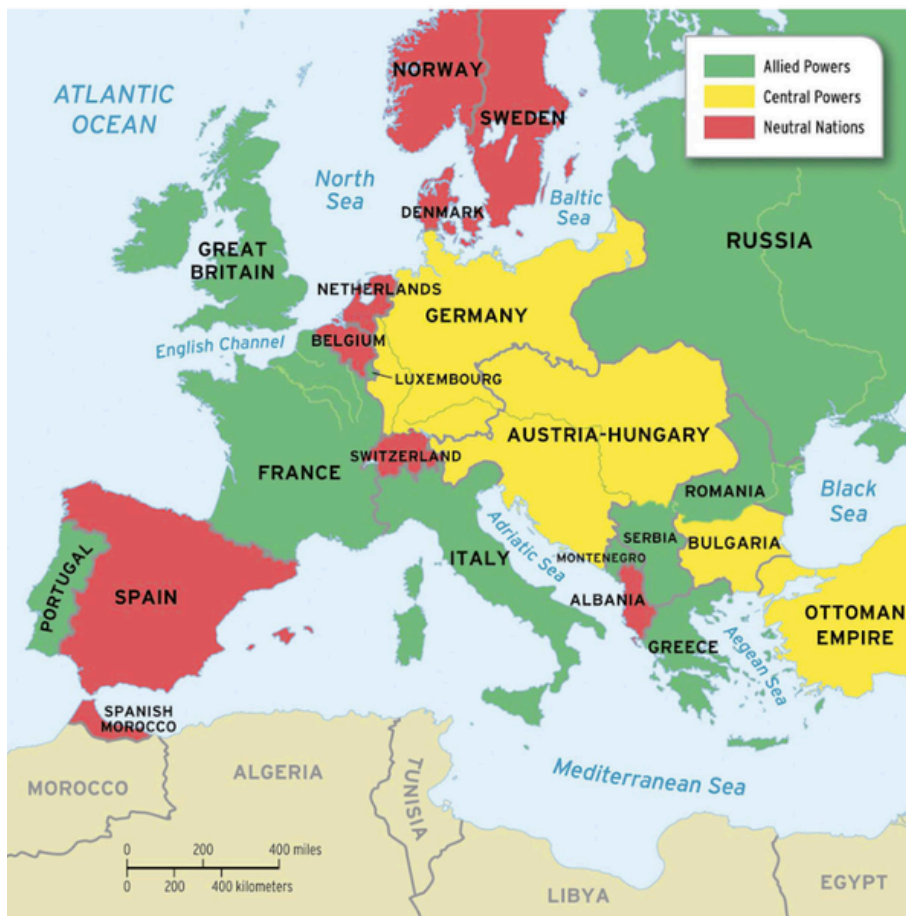
Europe before WWI