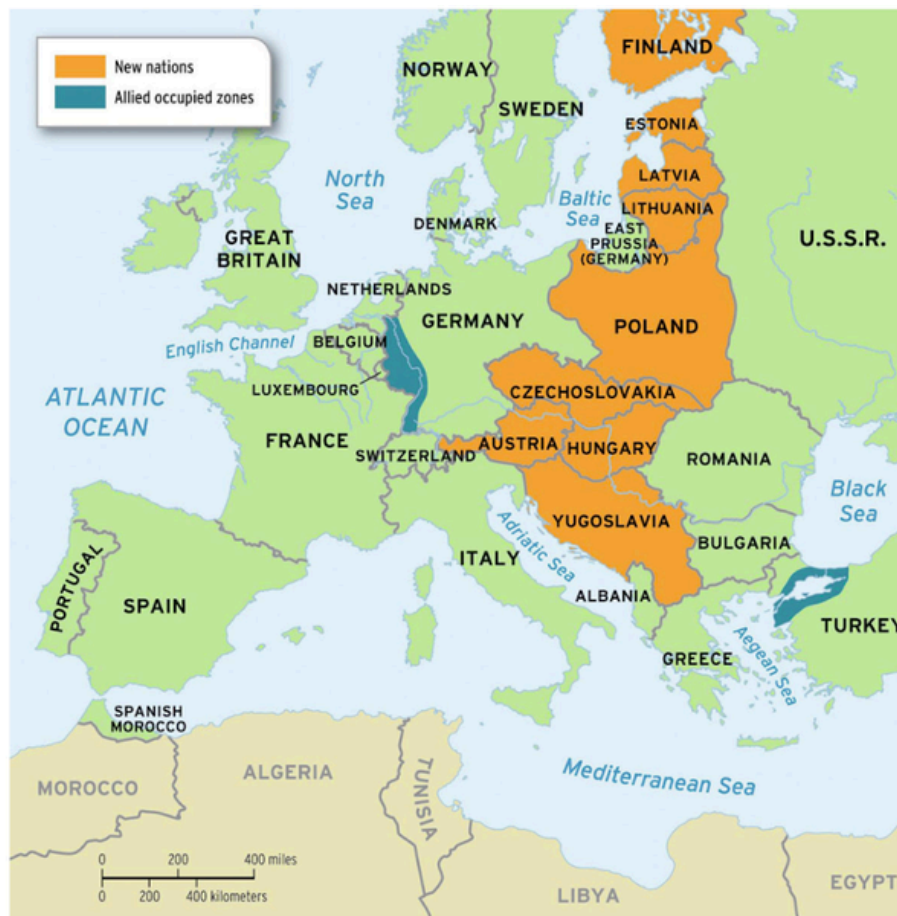
Europe after WWI