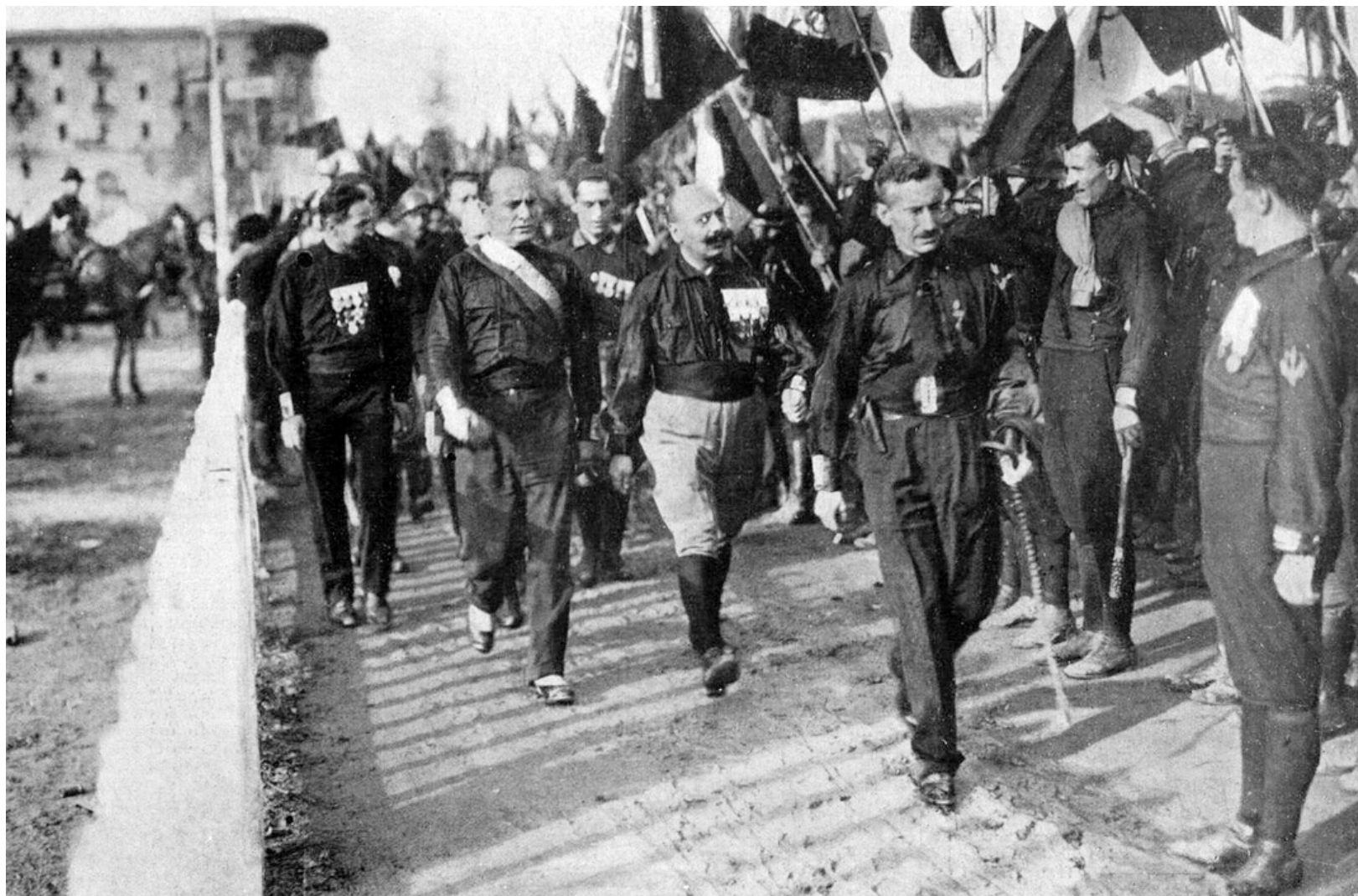
Маршът до Рим, 1922 г.