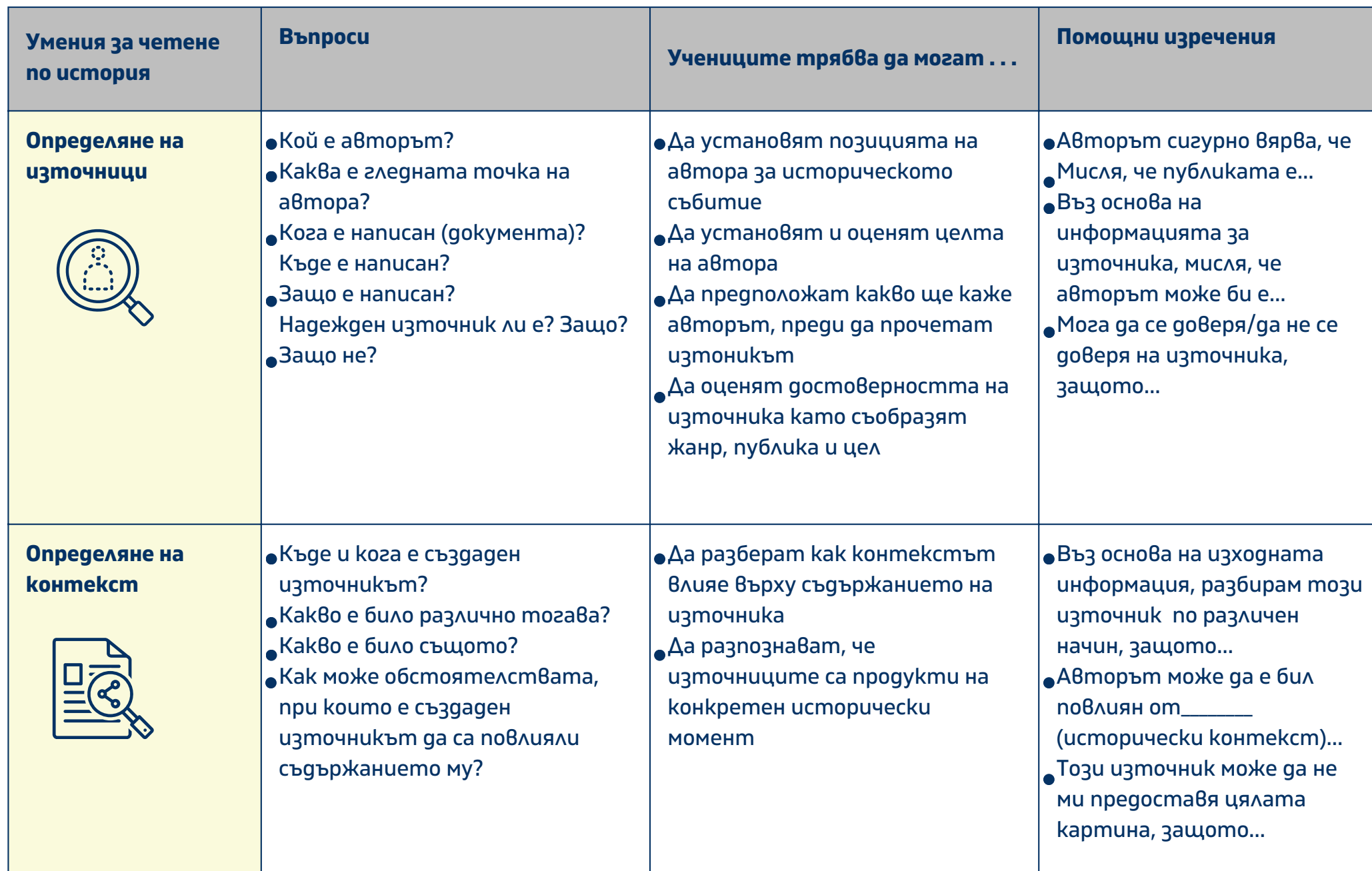
ТАБЛИЦА ИСТОРИЧЕСКО МИСЛЕНЕ